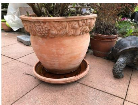
Le moustique dispose d'un gîte idéal pour nidifier dans cette coupelle bien remplie.

Certains pots, notamment les plus gros, sont difficiles à déplacer pour les vider. Une astuce empêche le moustique tigre de pondre : remplir la coupelle de sable.