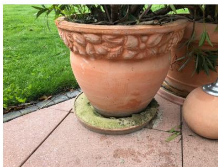
Le sable dans la coupelle empêche le moustique tigre de pondre.

Consultez le site internet du CANTON pour les astuces et informations détaillées